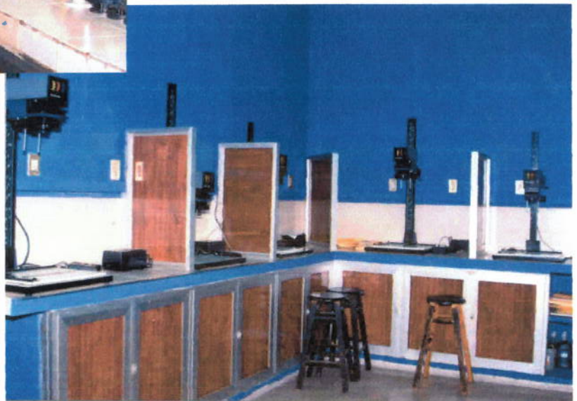
Impresoras del taller de fotografía