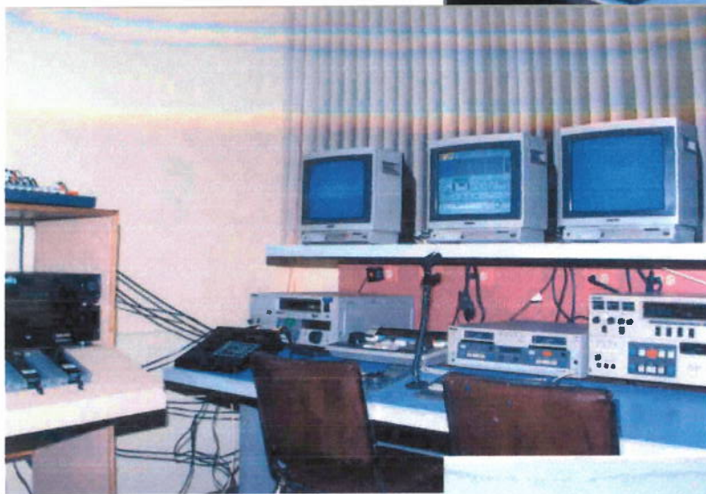
Cabina de edición foro dos