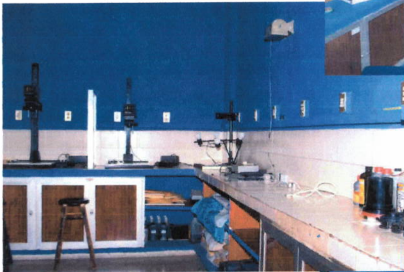
Interior del taller de fotografía