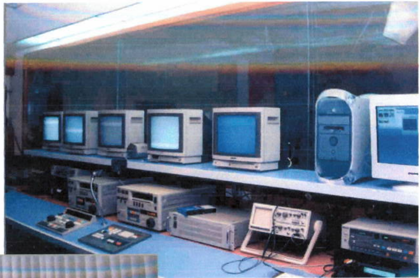
Cabina de postproducción