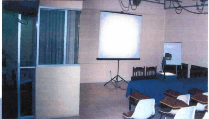
Foro dos de televisión