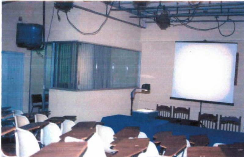
Panorámica del foro dos de televisión