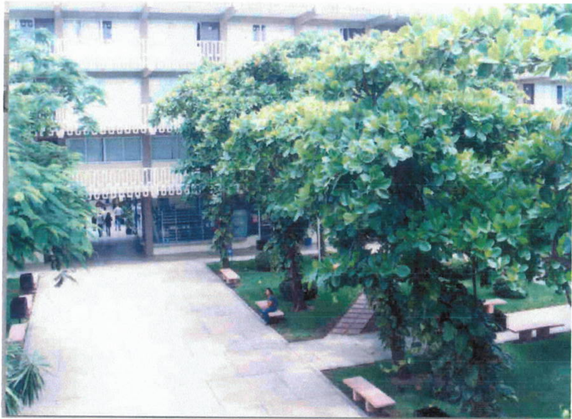
EDIFICIO UNO DE LA UCC