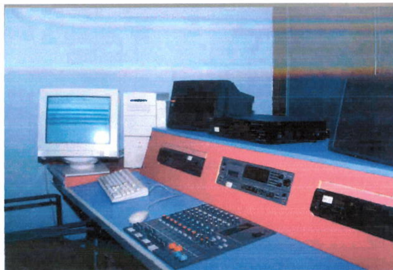
Consola de control cabina dos de radio