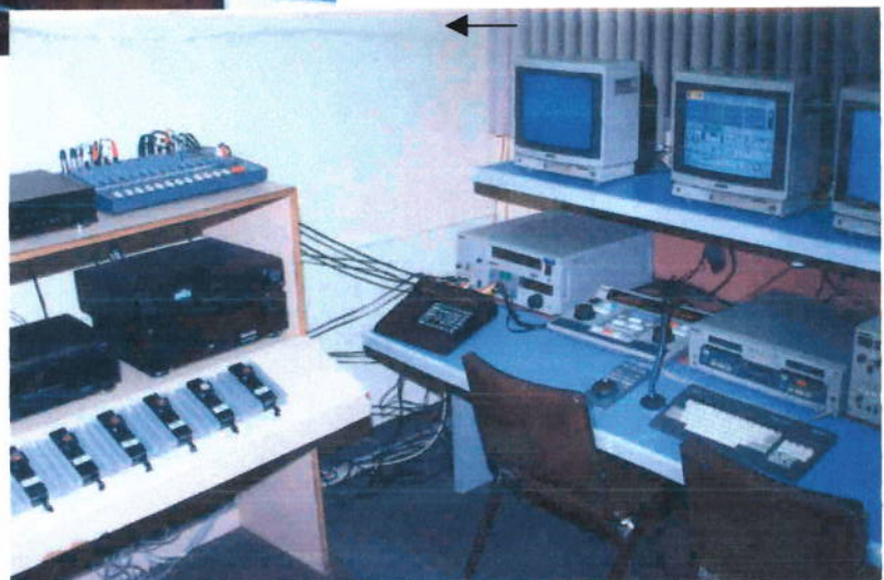
Controles de edición foro dos de televisión