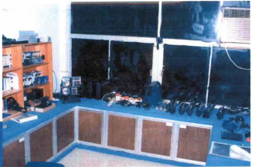
Resguardo de equipo de los talleres