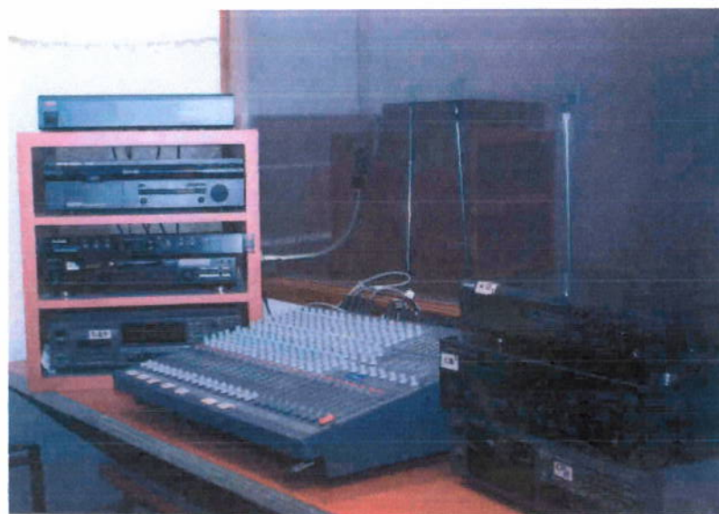
Consola de controles cabina uno de radio