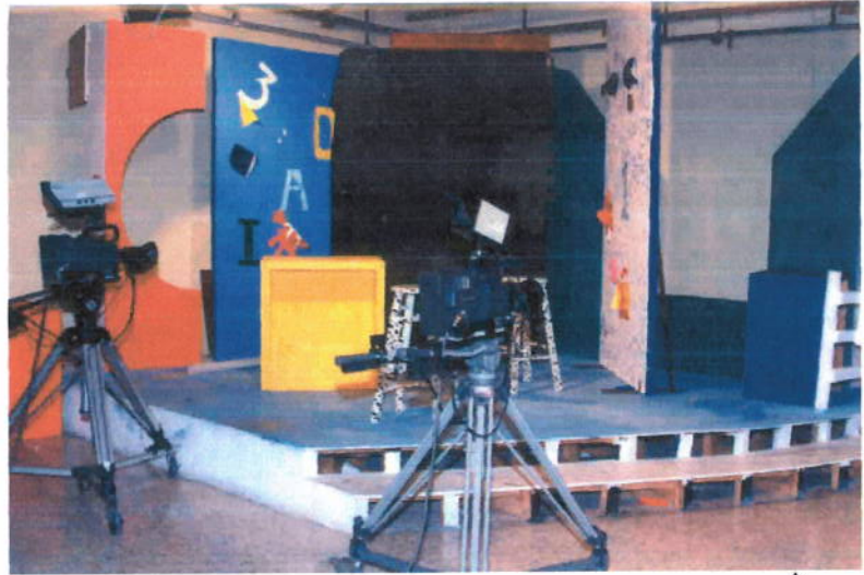
Interior del foro uno del taller de televisión ↑