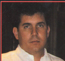
Así dirige Eugenio Azcárraga Televisa Monterrey