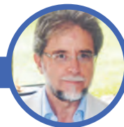
Javier Esteinou Madrid*