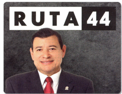
Jueves 21:00 / viernes 9:00 domingo 15:00 hrs.