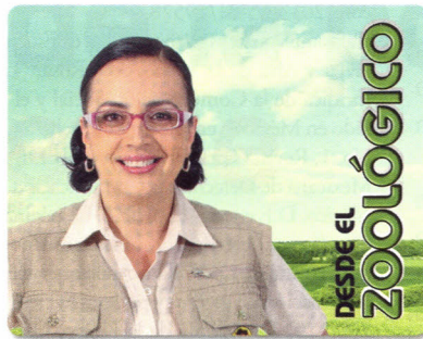
Lunes 10:00 / miércoles 17:00 sábados y domingos 11:30 hrs.