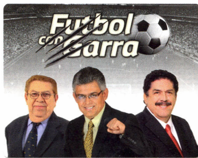
Lunes y jueves 19:00 martes y viernes 12:00 hrs.