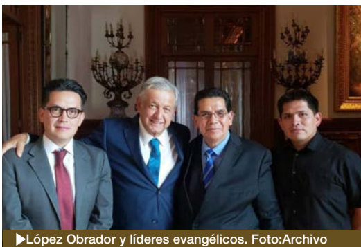
▶ López Obrador y líderes evangélicos.