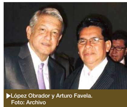
► López Obrador y Arturo Favela.

Se corre el enorme riesgo que difundan un pensamiento conservador, que refuerce el rol subordinado de las